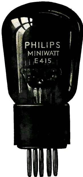
\frac{3}{4} nat. Gr.

Die E 415 ist für N.F.-Transformatorverstärkung bestimmt.