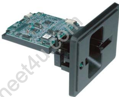
Frontal plástico tipo M