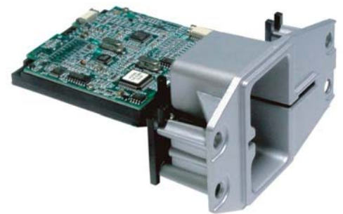
Frontal metálico tipo Flush