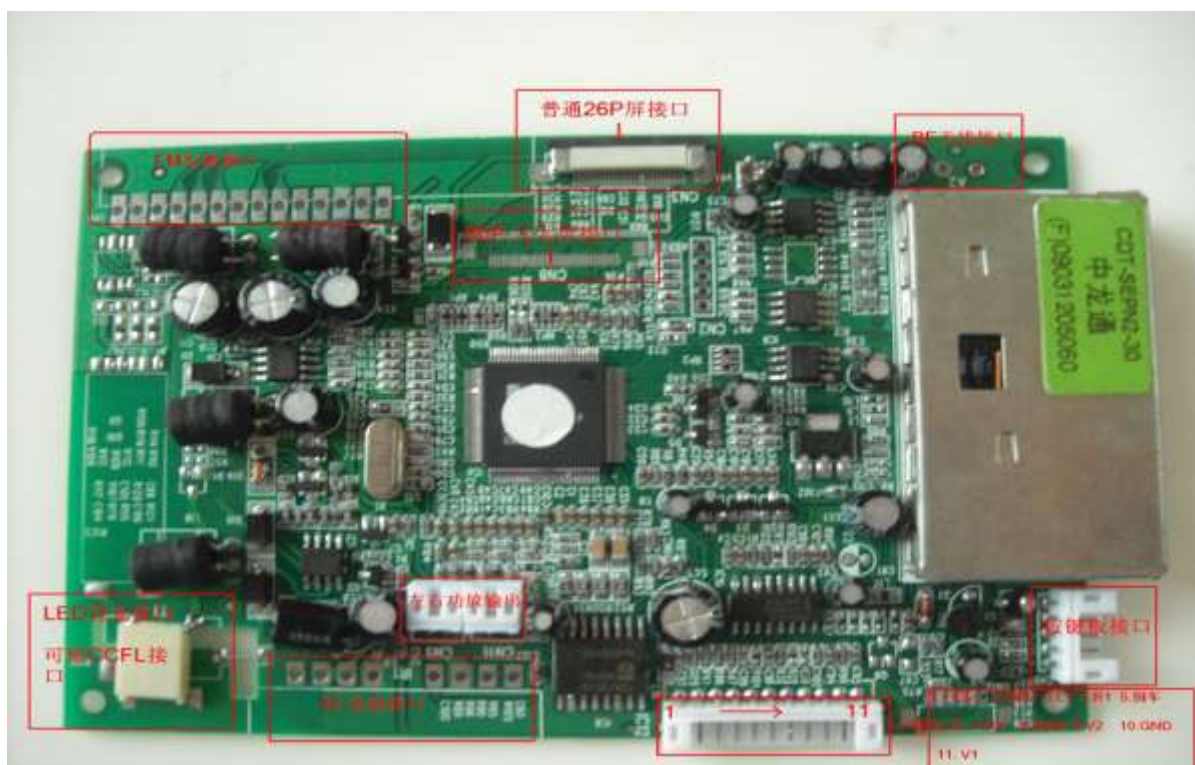
附录 2: 驱动板外观

深圳天宇朗通科技有限公司, 电话, 075528896081 075528435851 手机, 13501573920 邮箱, 13501573920@139.com , Haier-tcl-putian@139.com 公司展销地址, 中国深圳华强北振华路高科德四楼 42073